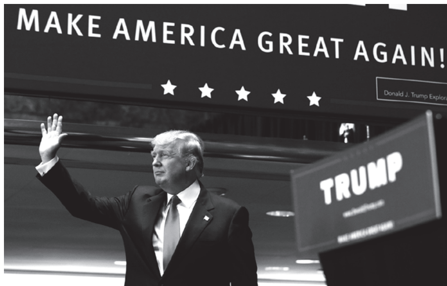
Рисунок 1 – Предвыборная речь Д. Трампа в Висконсине.

Вначале обратим внимание на невербальные аттракторы дискурса Трампа (см. рисунок 1).