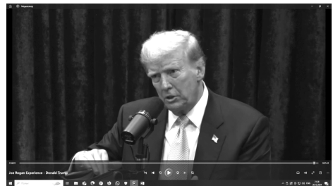
Фото 4 – Д. Трамп использует жест доминирования 5 Photo 4 – D. Trump uses a gesture of dominance