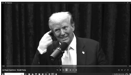
Фото 3 – Д. Трамп иллюстрирует попытку покушения 4 Photo 3 – D. Trump illustrates an assassination attempt