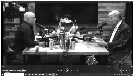
Фото 1 – Д. Трамп использует жесты открытости 2 Photo 1 – D. Trump uses gestures of openness

На уровне кинесики, в частности жестов, Д. Трамп подкреплял общие линии вербальной коммуникации. В частности, активно создавалось ощущение открытости, готовности к переговорам и миру, компромиссу через постоянное открытие рук, разворота тела по отношению к собеседнику, общей спокойной незажатой позы. По отношению к демократической партии и при ее упоминании на протяжении 1 минуты 15 секунд Д. Трамп принимал зажатую позу, иллюстрируя контейнерную концептуальную метафору, когда человек хочет запахнуть поплотнее одежду, замотаться во что-то или плотно скрестить руки. Одновременно общая поза, наклон головы совместно с риторикой должны были проиллюстрировать решимость и отсутствие сомнений в правильности принимаемых решений (см. Фото 1–4).