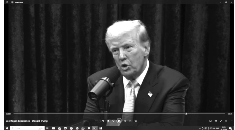
Фото 2 – Д. Трамп использует жесты закрытости 3 Photo 2 – D. Trump uses gestures of closeness