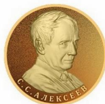
Рисунок памятного нагрудного знака «К 100-летию Сергея Сергеевича Алексеева» (лицевая сторона)