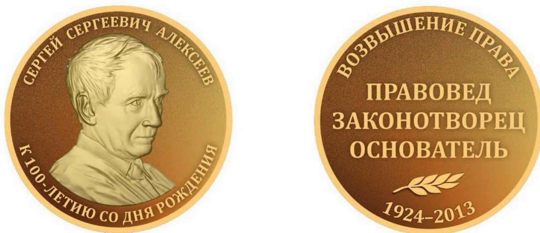
Рисунок памятной медали «К 100-летию Сергея Сергеевича Алексеева» (лицевая и оборотная стороны)